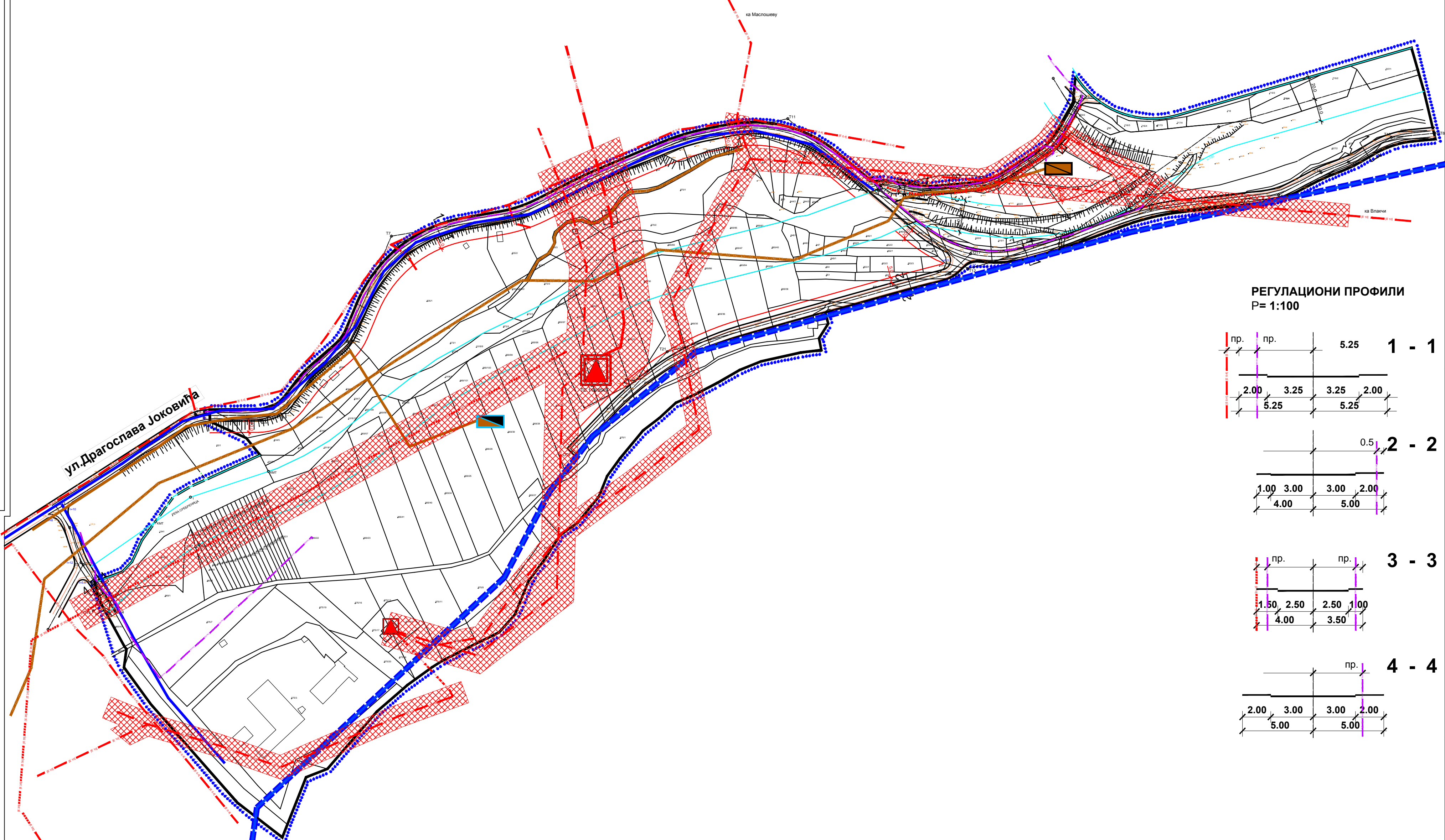
РЕГУЛАЦИОНИ ПРОФИЛИ R= 1:100